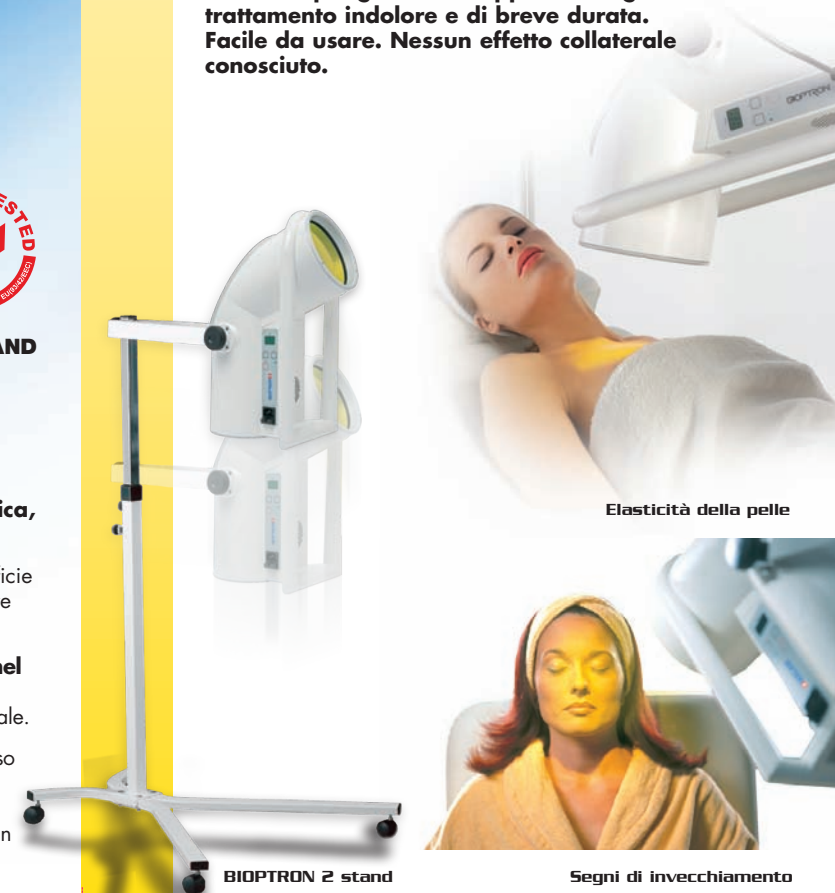
Elasticità della pelle

La Terapia della Luce BIOPTRON ha un'ampia gamma di applicazioni grazie a un trattamento indolore e di breve durata. Facile da usare. Nessun effetto collaterale conosciuto.